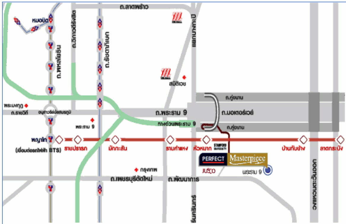
รูปที่ 1-1 ที่ตั้งโครงการโดยสังเขป

เส้นทางการคมนาคมเข้าสู่พื้นที่โครงการ จะใช้การคมนาคมทางบกโดยอาศัยรถยนต์ ซึ่งทางเข้า-ออกโครงการจะเข้าออกได้ทั้งจากถนนมอเตอร์เวย์ และ ถนนพัฒนาการ ใกล้ทางด่วนพระราม 9 (รูปที่ 1-1)